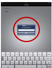
ログインパスワード