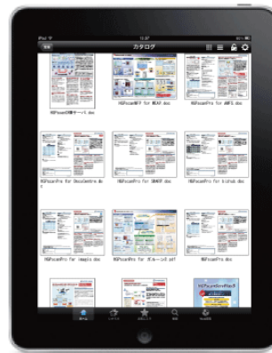
フォルダサムネイル