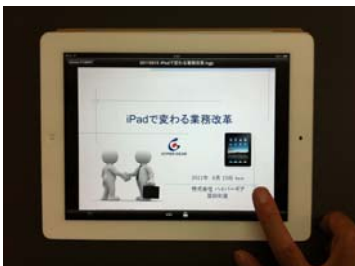
(HGViewLT パブリッシャーが必要)