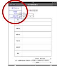
画面キャプチャー抑止