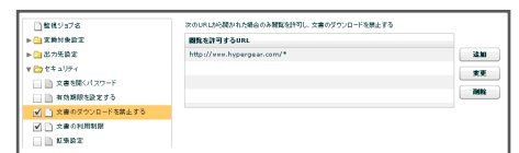
閲覧を許可する URL 指定

指定した年月日まで、あるいは、変換した日から一定期間のみ閲覧可能な「有効期限付 PDF」や、指定した共有フォルダや URL からのみ閲覧可能で、クライアントにダウンロードしたり、メールに添付して送付したりすると見られなくなる「ダウンロード禁止 PDF」を、簡単に作成することができます。これらのファイル制御を、認証サーバなどへのアクセスが不要なオフライン環境でファイルベースの運用だけで実現できます。また、協力会社等への指示書や仕様書等を「有効期限付 PDF」で提供する等の運用で、利便性を損なうことなくセキュアな文書共有が実現できます。